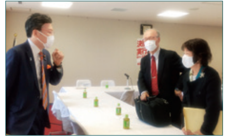
▲橋本岳先生に子ども家庭庁の依頼