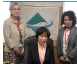
◀堀内詔子環境副大臣