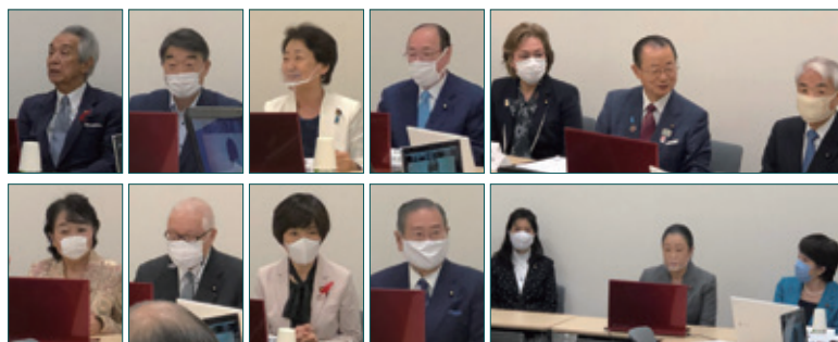
▲中曾根弘文先生、櫻田義孝先生もご参加いただきました。