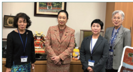
▶埼玉県13区を基盤に政治活動を行っていらっしゃる。地場産の青パパイヤカレーの生産奨励とレシピ開発にも食の安全・安心の心がこもっています。

私は、消費者問題に関する特別委員長として、昨年「食品ロス削減推進に関する法律案」を成立させることができましたが、法律をつくることが目的ではなく、広く国民の理解を得て連携・協力していく必要があると考えます。そのためにも栄養士の皆さんとコツコツと普及啓発を行なっていきたいと思っております。