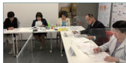
◀アクリル板で仕切り、換気を行い安全対策を行いました。

総会は、2019年度の活動報告収支決算書の承認、2020年度の活動計画及び収支予算が承認され、2020年度・2021年度連盟役員が承認され終了致しました。