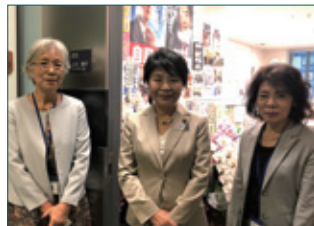
◀上川陽子法務大臣