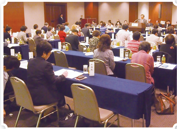
支部長会議の様子